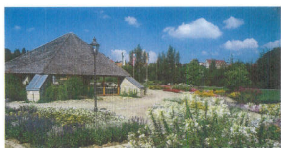
Kurpark in Kötzing