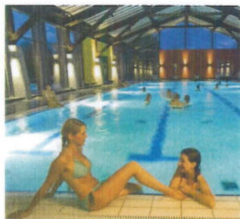
AQACUR Badewelt, Kötzing

Sehenswertes: Schloss Miltach, Altrandsberg Weltkunstmuseum, Wallfahrtskirche Mariä Himmelfahrt auf dem Bogenberg mit Blick ins Donautal.